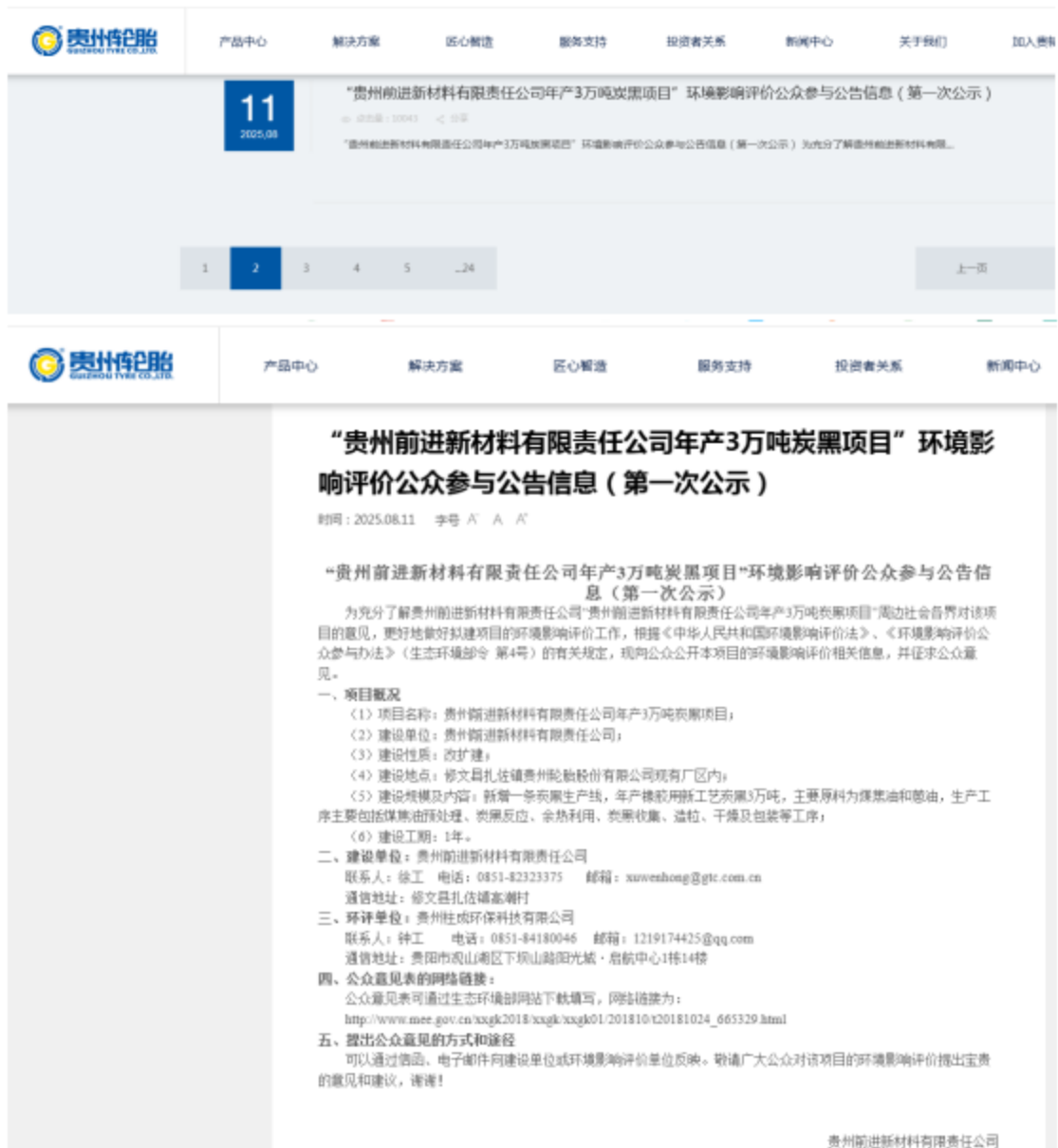
图 2-1 贵州轮胎网（即总公司贵州轮胎股份有限公司的官方网站）公示情况