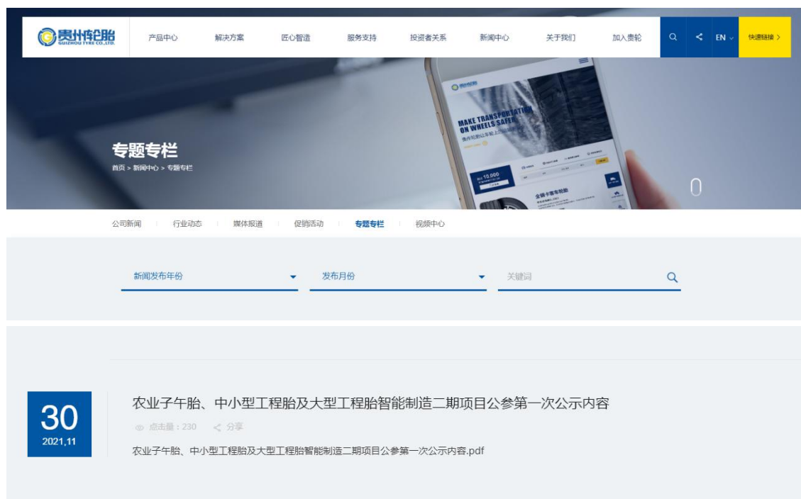
图 2-1 贵州轮胎网（建设单位官网）公示情况

根据《环境影响评价公众参与办法》（生态环境部令第4号）中第九条要求，建设项目环境影响评价公众参与第一次公示应通过建设单位网站、建设项目所在地公共媒体网站或者建设项目所在地相关政府网站进行公示。本项目第一次公示于2021年11月30日贵州轮胎网（建设单位官网），其公示载体与《环境影响评价公众参与办法》相符合，公示情况见图2-1。